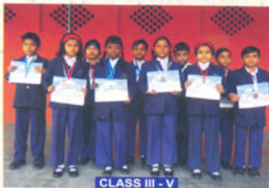
CLASS III - V