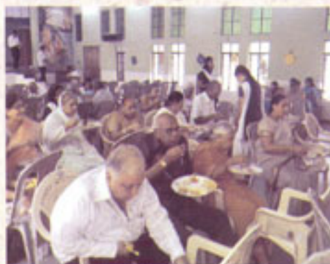
GRAND PARENT'S DAY