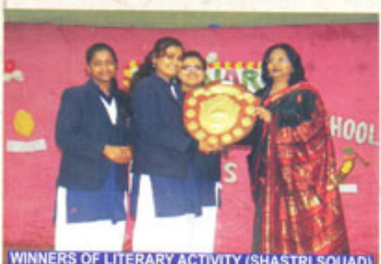
WINNERS OF LITERARY ACTIVITY (SHASTRI SQUAD)