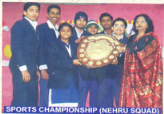
SPORTS CHAMPIONSHIP (NEHRU SQUAD)