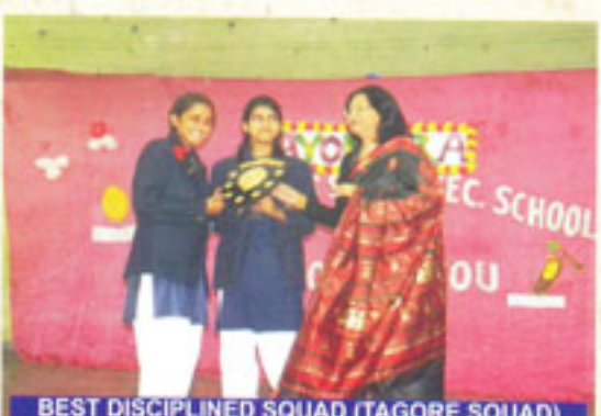
BEST DISCIPLINED SQUAD (TAGORE SQUAD)