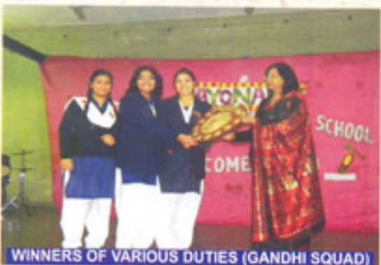
WINNERS OF VARIOUS DUTIES (GANDHI SQUAD)