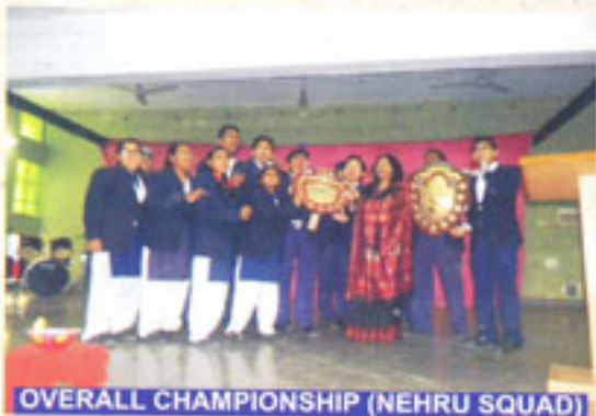
OVERALL CHAMPIONSHIP (NEHRU SQUAD)