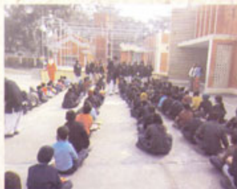
CHRISTMAS WITH STUDENTS' OF ST. PATRICK